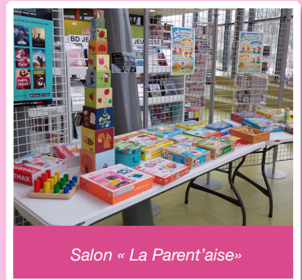
Salon « La Parent'aise »