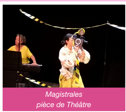
Magistrales pièce de Théâtre