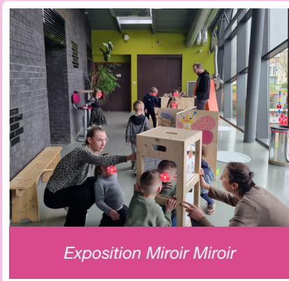
Exposition Miroir Miroir