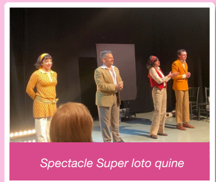
Spectacle Super Ioto quine

La médiathèque sera prochainement présente dans le cadre de Partir en Livre, le 4 juillet, à Schneider au Cœur, afin de proposer des animations autour du livre et de la lecture.