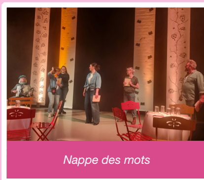
Nappe des mots