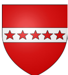
Les Bons Villers Belgique