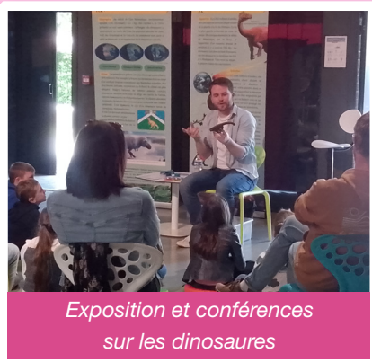
Exposition et conférences sur les dinosaures