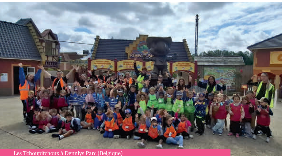
Les Tchoupitchoux à Dennlys Parc (Belgique)

Enfin, la formation et l'accompagnement des jeunes animateurs demeurent un axe prioritaire. Renouveler et renforcer les équipes permettra à la Ville de disposer d'un vivier de ressources compétentes et engagées, afin de répondre pleinement aux exigences d'encadrement et de préparer les adultes responsables de demain.