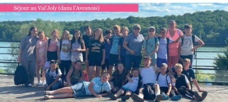
Séjour au Val'Joly (dans l'Avesnois)