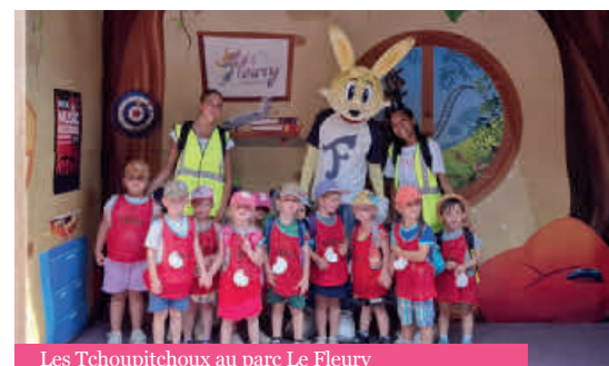
Les Tchoupitchoux au parc Le Fleury