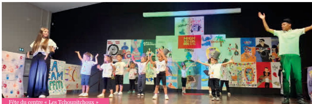
Fête du centre « Les Tchoupitchoux »