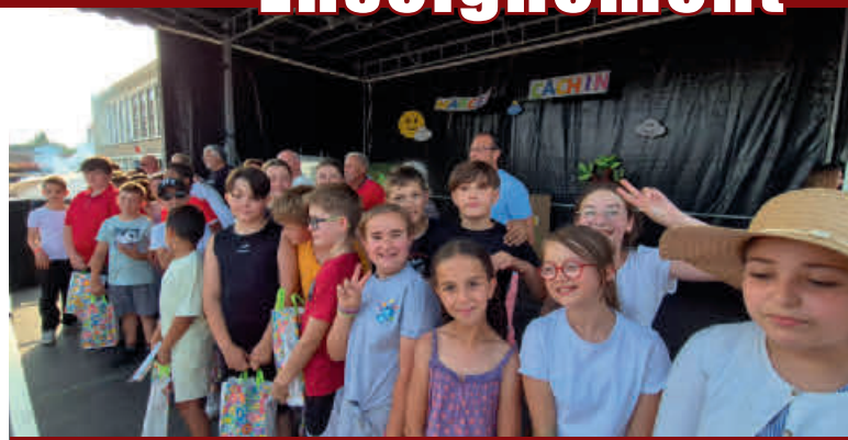
Les élèves de l'école élémentaire Marcel Cachin (ci-dessus) et de l'école Schneider (ci-dessous) étaient ravis de recevoir leur cadeau de la part de la municipalité

Les sourires et la fierté des enfants ont témoigné de l'importance de ce moment, partagé avec leurs enseignants, leurs familles et les élus présents.