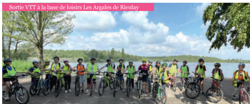
Sortie VTT à la base de loisirs Les Argales de Rieulay