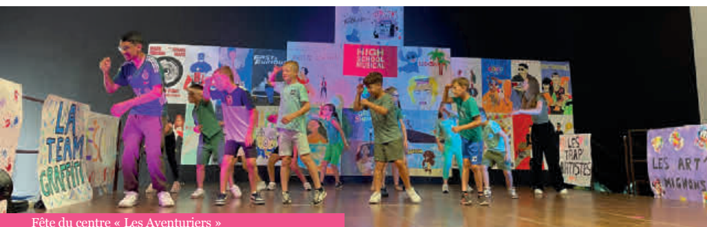
Fête du centre « Les Aventuriers »