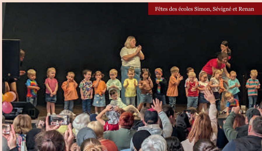
Fêtes des écoles Simon, Sévigné et Renan