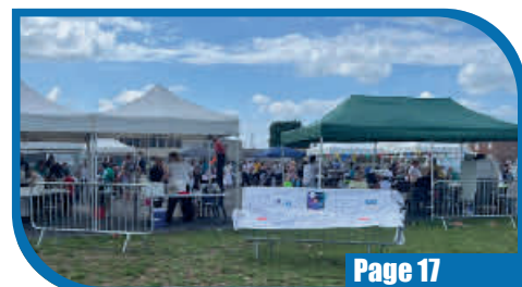
Accueil de loisirs