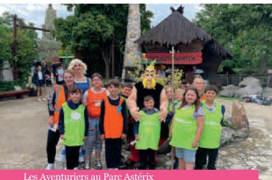
Les Aventuriers au Parc Astérix